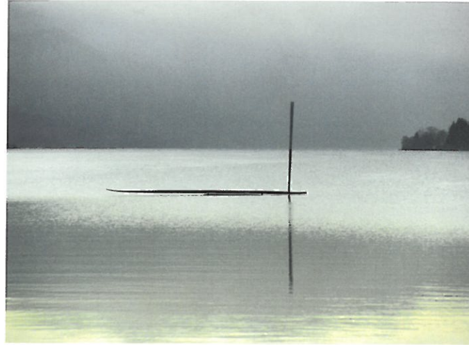
2 Marianne Maderna-Sehzeichen, 2001 Unterach, Bundesstraße Mondsee-Unterach, direkt an der Abzweigung nach St.Gilgen