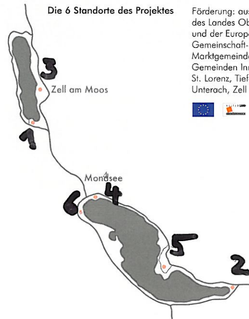
Die 6 Standorte des Projektes

ISBN 3 85252 760 0 publication PN° 1 Bibliothek der Provinz Tel.: 02856/3794