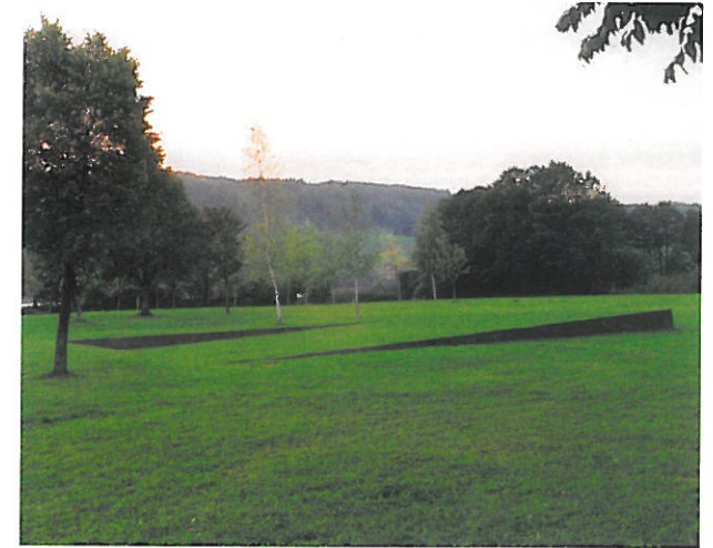
3 Benoit Tremstal-Gekippte Fläche, 1999 Öffentlicher Badeplatz im Ort Zell am Moos