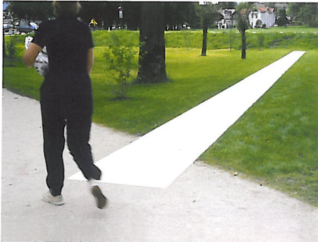
4 Karl-Heinz Klopff-Einmal Vierzig, 2005 Mondsee, Verlängerung der Lindenalle über die Bundesstraße Richtung See, gleich nach der Kapelle links, ca.100 m