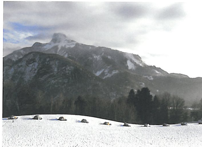
5 Richard Nonas-Stoneline, 1999 Innerschwand, Abfahrt von der Bundesstraße Mondsee-Unterach beim Hotel Seehof (Gemeinde Innerschwand-Loibichl) auf dem Güterweg Seehof, ca. 300 m