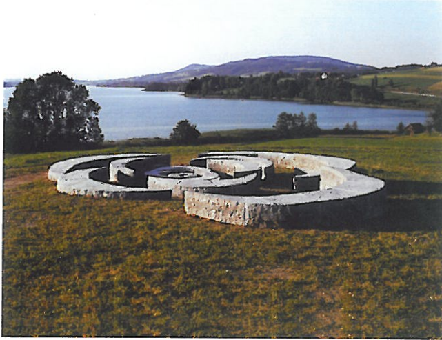
1 Sjoerd Buisman-Phyllotaxis-Irrsee, 1999 Zwischen Mondsee und Zell am Moos, Abzweigung Irrsee West, nach dem Kastenwirt Weg zum Westufer des Irrsees, auf der Anhöhe rechts, am südlichen See-Ende, Gemeinde Tiefgraben